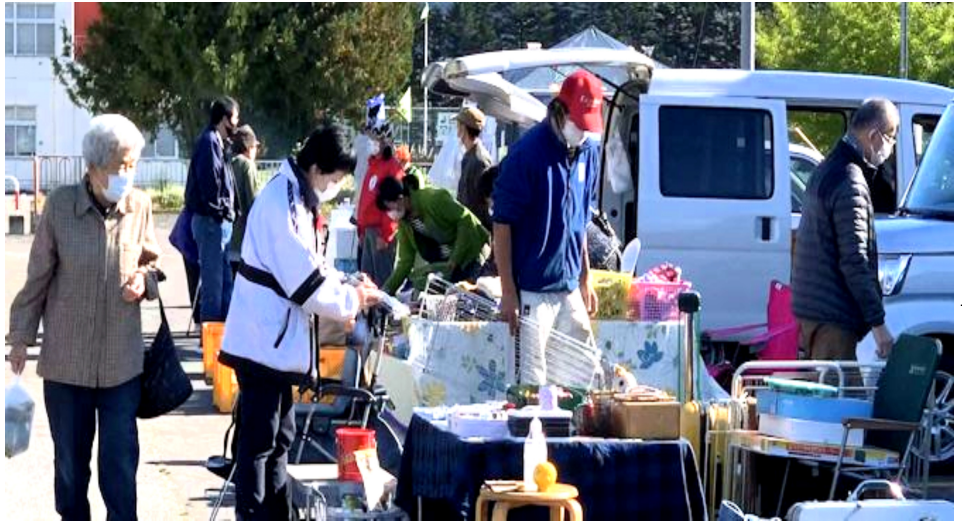
写真＝新鮮な野菜などの出店で賑う軽トラ市 屈足総合会館駐車場にて